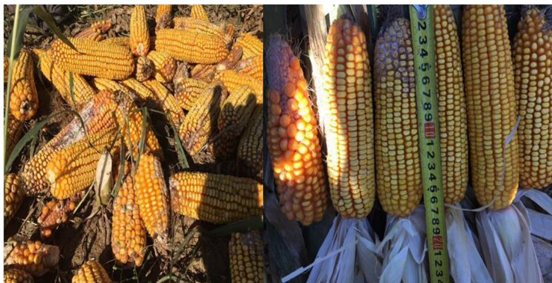
（摄于2016年9月28日辽宁铁岭市昌图县）

去年，东北局地（尤其是辽宁等）传统优质玉米产地品质“塌方”是造成2017年春夏优质玉米价格暴涨至2000元/吨的重要原因。除了前面提高的冬季温度差异以外，2016年9月下旬开始我国北方玉米主产区连续阴雨天气也不利于玉米品质。当时，东北地区以辽宁、吉林玉米霉变趋势最为明显，辽宁玉米普遍霉变粒可达到5%，偏高可达到10%。参见下图对比。